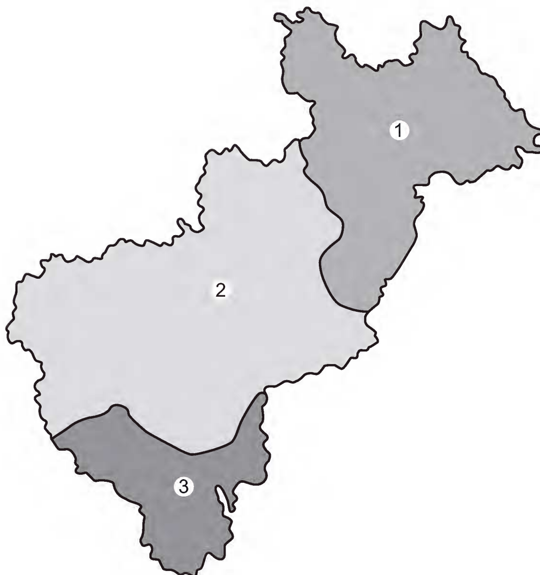
Fig. 1. Regiones fisiográficas del estado de Querétaro. 1. Sierra Madre Oriental. 2. Altiplanicie Mexicana. 3. Eje Volcánico Transversal.

Para una definición más amplia y detallada de los aspectos ambientales, así como de las características de la flora y de la vegetación del estado, cabe consultar el trabajo de Zamudio et al. (1992).